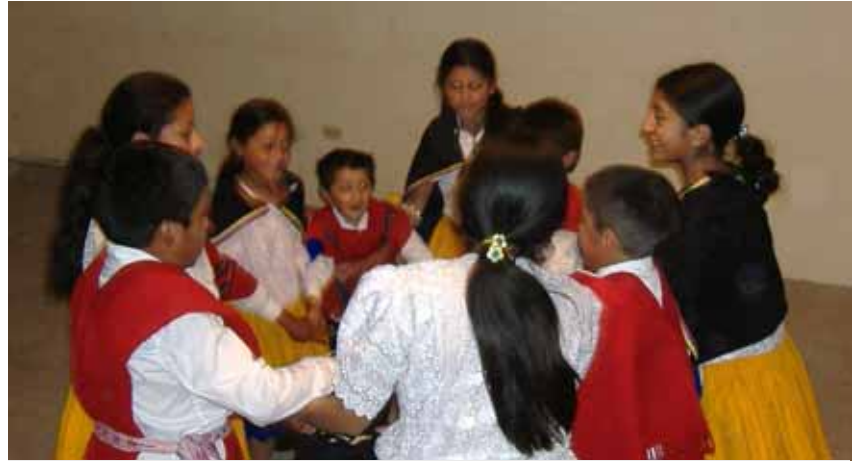
Las niñas y los niños de la Victoria del Portete bailaron con alegría varias piezas de la música tradicional andina.