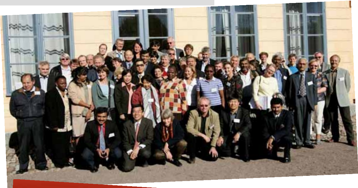
Reunión de ReAct Global en la Universidad de Uppsala, en septiembre del 2005.