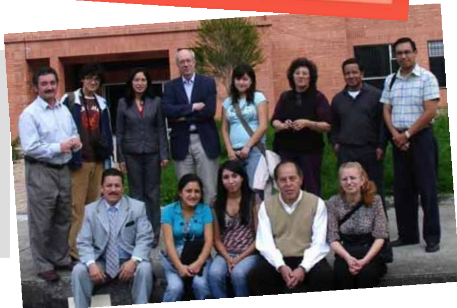
Parte del equipo de ReAct en la Facultad de Ciencias Médicas de la Universidad de Cuenca.